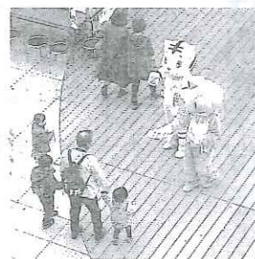
トラのたも つ&カエルの よろー