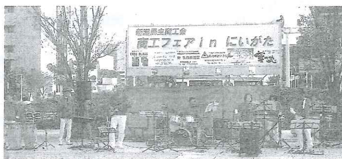
熱帯エレキバンドによるベンチャーズ・フォー ークなどの演奏に聞き惚れました。