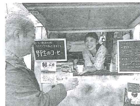
県外からはるばるエチオピア の珈琲を皆さんにお届け。