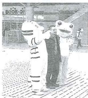
観光客の方と 3ショット