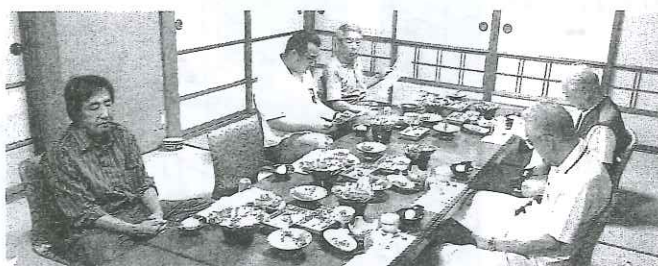
消費税についての説明を受ける参加者

新入会員さんも民商の活動への理解も深まり「今後集まりがあればまた参加したい」と期待を寄せてくれました。