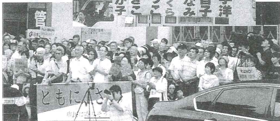
多くの有権者の前で演説するうち越さくらさん(右) 演説を聞く有権者(下)