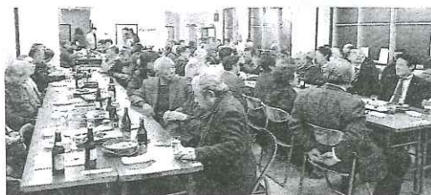
おいしいお酒 と料理に舌鼓

仲間増やしの表彰 米山支部(読者・会員) 駅前支部(読者) 万代支部、亀田支部、 石山支部、内野支部 (会員)