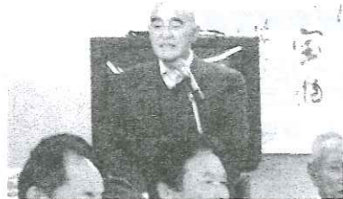
渡部県連会長あいさつ