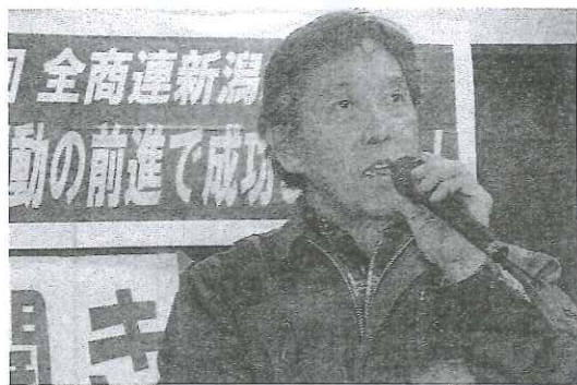
活動報告する本名さん・松浜支部

支部の自主計算班会を成功させよう。そのために税金相談員学習会にたくさんの役員のみなさんの参加をお願いします。