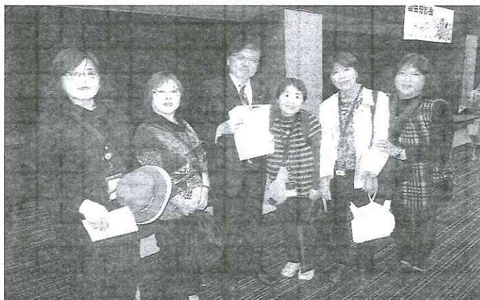
井上哲士参議員訪問