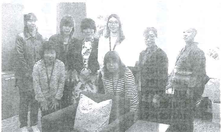
森ゆうこ参議員訪問