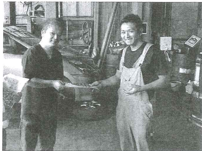
青年部・部員訪問

家族経営の小さな会社なので、仕事が重なってしまうと、お待たせすることも有りお客様