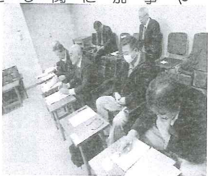
県土木部建設業室と交渉

国・県とも「社会保険加入について切実な声はなかなか入ってこない」としつつ「生の声をできるだけ集めて対策していくことが必要」（国）「下請業者の実情をふまえた仕事をする必要がある」（県）と私たちの声に真剣に耳を傾けました。その上で国・県とも「国交省が示している通り、一人親方や従業員四人以下の事業主は社会保険に加入しなくても現場に入れる」と明言し「関係団体に通知を出しているが、行き過ぎた