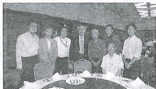
太田全商連会長と新潟県代議員

が蜂起した。この結果国王が追放されたことを話してくれました。そして革命のシンボル自由の女神のことも。