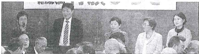
共産党市議会議員団