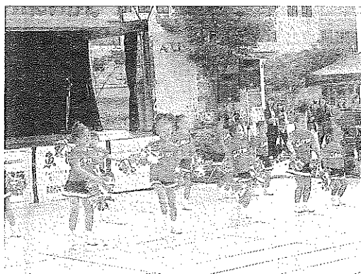
新潟万代ダンススクール

や終わってからハイタッチする姿があったりと出演者も観客も楽しんでくれたように感じます。次回も今回以上のイベントにしていきたいと思えます。