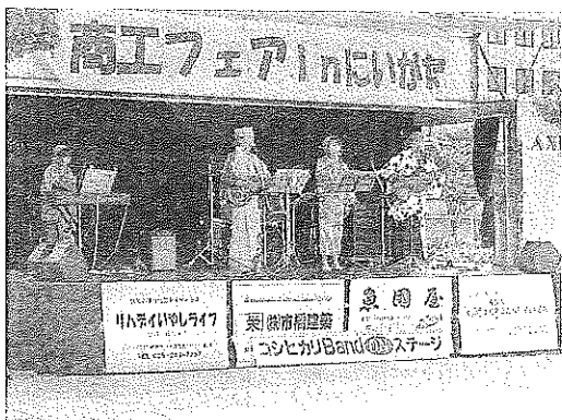
コシヒカリバンド

で応援しているファンの方々、L.E.Fや万代ダンススクールの際は、一緒に観客席で踊る方々が目立ち大いに会場を盛り上げました。出演者の方々は、「楽しかった。また踊りたい」