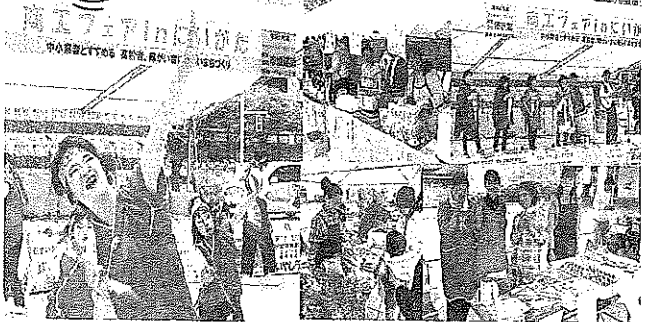
お祭り・文化祭